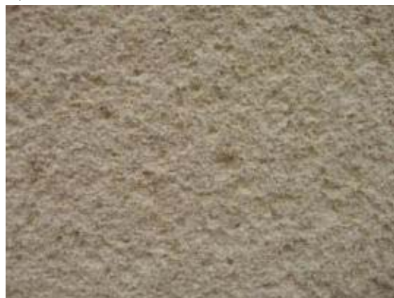
obr. 3 - škrábaná struktura

Po nástupu moderních technologií v 21. století se ve velké míře ustoupilo od používání břízlitu na fasádách a omítka byla nahrazena tenkovrstvými šlechtěnými probarvovanými omítkami. V posledních letech se však zájem o břízliti obnovuje, zejména pro jeho mechanické vlastnosti, vysokou pevnost a odolnost proti klimatickým vlivům, ale také proto, že jeho struktura se jeví jako zajímavá pro povrchovou úpravu fasád moderních staveb, kdy bývá architektky využíván jako finální vrstva fasád nových objektů. Kromě toho se starší objekty opatřené břízlitem dostávají do oblasti památkové péče a to vše přispívá k renesanci omítek břízlitového typu.