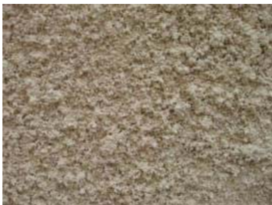
obr. 2 – stříkaná struktura

Pro břízliti jsou typické dvě základní struktury. Struktura stříkaná (obr. 2) se vyznačuje množstvím výstupků a nerovností vystupujících z plochy omítky. Struktura škrábaná (obr. 3) je charakteristická prohlubněmi vzniklými po vyškrábaných kamíncích. Zejména struktura škrábaná může být doplněna přidavkem drčené slídy, která dá břízliti typický třpytivý efekt. Barevné provedení břízlitů bylo jednoduché a zahrnovalo většinou škálu šedých odstínů doplněnou o odstíny bílé, žluté, okrové a v ojedinělých případech také s nádechem do červena, hněda či zelena.